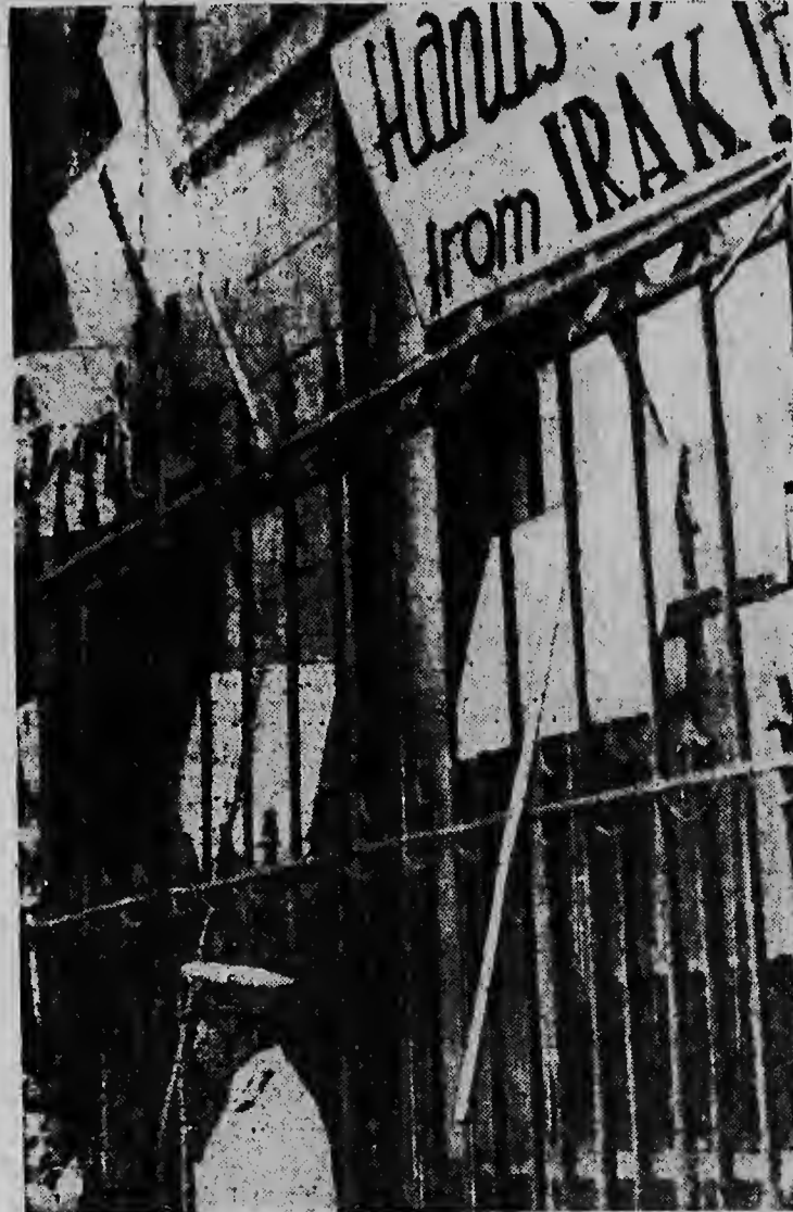
„NO MISHI CU IRAK“. — Demonsirantenan ruso cu a marcha dilanti dje embahadanan di Estados Unidos y Inglaterra na Moscow protestando contra dje desembarco di trupanan Americano y Ingles na Mediano Oriente. Nan a laga un bordchi riba e edificio di Estados Unidos cu ta bisa: „Hands off from Irak“ („No mishu cu Irak“).

(Lesu e relato tocante examen pa trafico riba pagina tres).